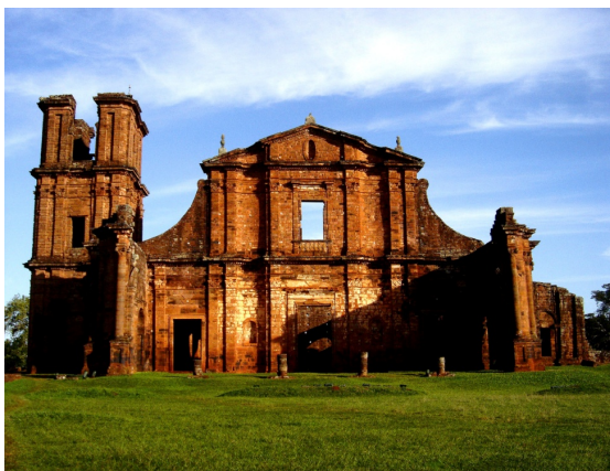
Ruína de Igreja Jesuíta. São Miguel das Missões – RS Salvador, Bahia